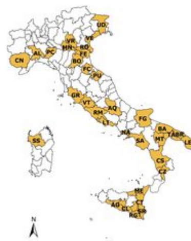
la rete di rilevazione Ismea